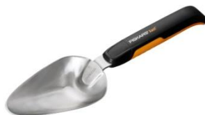
Narzędzia Xact™ ok. 46 zł