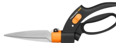
Nożyce GS42 Servo-System™ ok. 110 zł