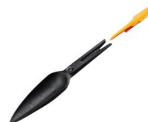
Łopatką do wysiewu Solid™ ok. 25 zł